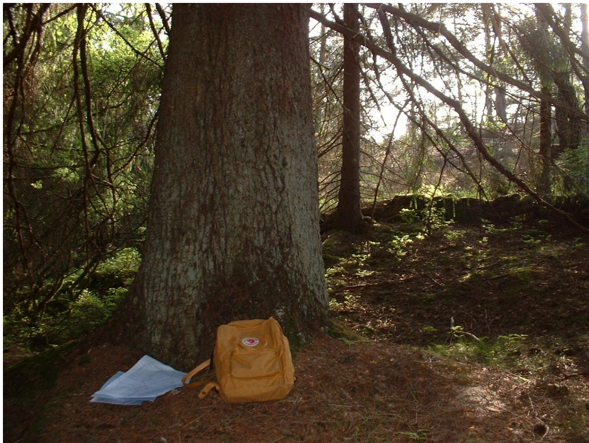
Figur 7 , Jättegran, Kyrkeröd 1:3, 2010-06-06

Fotot nedan, figur 7, visar den största granen (punkt12) vilken, som RKK påpekar, är av anseilig storlek. Omkretsen i brösthöjd är ca 3,5 m och detta bör vara en av de största granarna i trakten. Vi anser att den har ett högt bevarandevärde.