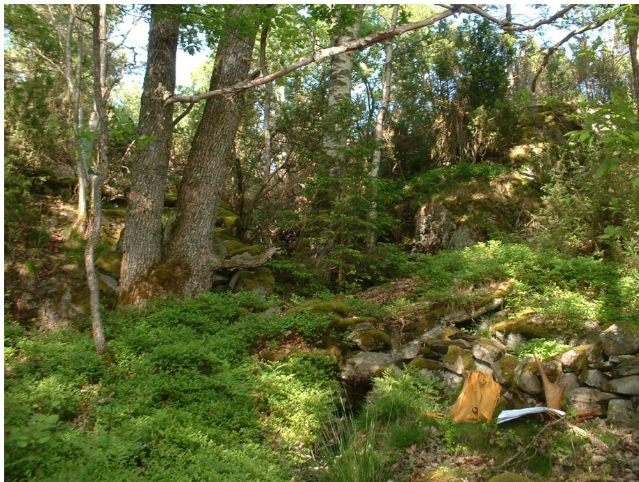
Figur 4. Bäck med stenbro och ek

Vi kan dock ha feltolkat kartan men, oavsett vilket, bör denna plats undvikas och vi instämmer i synpunkterna från RKK att detta är en olämplig passage.