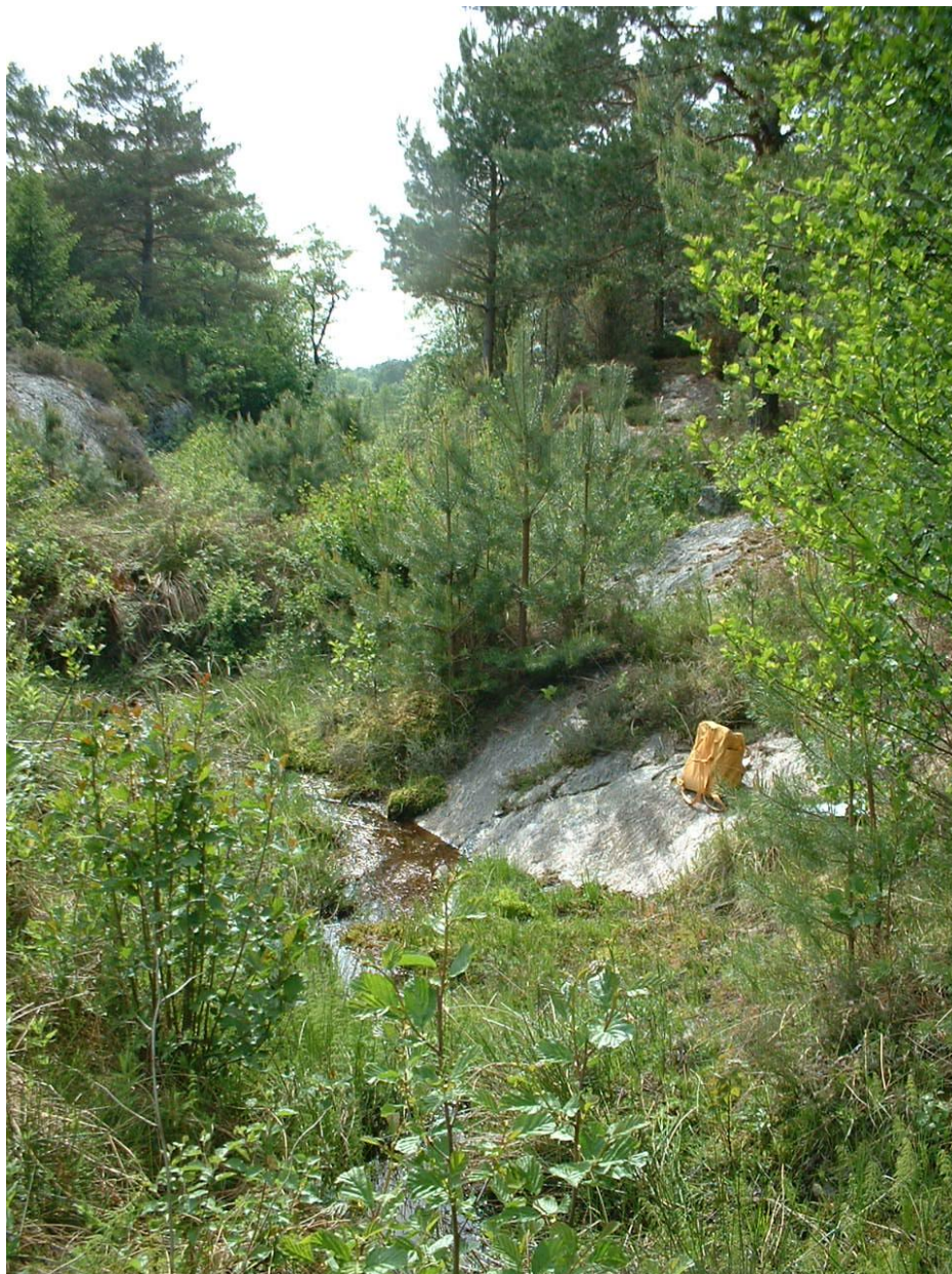
Figur 1 Dike mot gården Selen, Övre Hoga 2:9/3, 2010-06-06