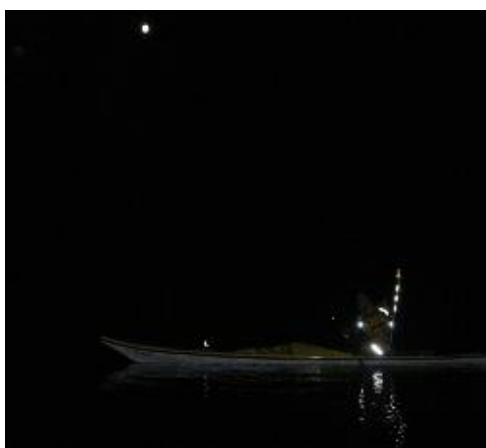
Kajak i mörker

Du är välkommen att hänga med på alla våra aktiviteter. Har du frågor ring respektive kontaktperson.