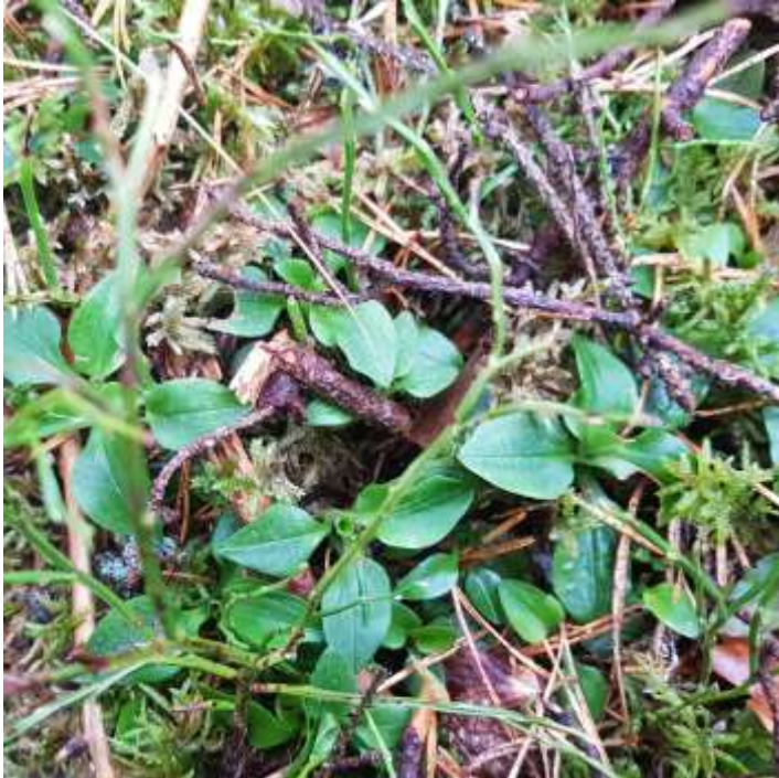
Några knärotsplanter i området