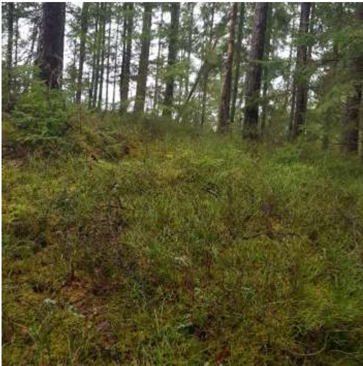
Lokal 1, I denna sydostsluttning växer det största beståndet av knärot