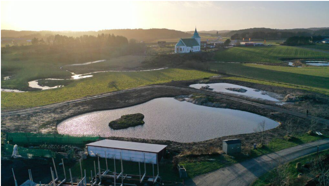
Våtmark i Torsby[/caption]

[caption id="attachment_1058" align="alignnone" width="563"]